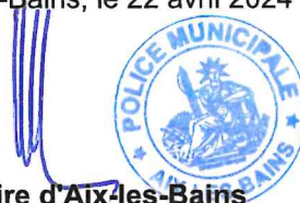
Le Maire d'Aix-les-Bains Renaud BERETTI